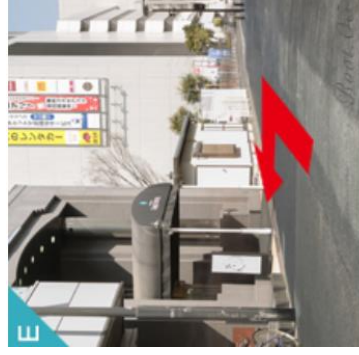
左側に新横浜グレイスホテルのサブエントランスがあります。