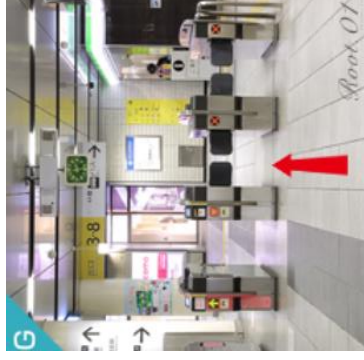
地下鉄の改札口を出て、右に進みます。