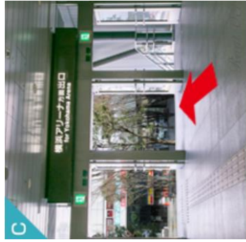
横浜アリーナ方面出口を降りてください。