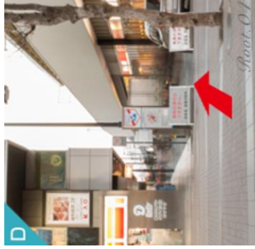
デイリーヤマザキとキュービックプラザの間の道を真っ直ぐ進みます。